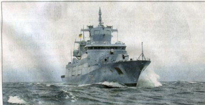
Erprobungsfahrt der Fregatte „Baden-Württemberg“, Typschiff der Klasse F 125, im Skagerak.

Die Fregatte hat eine Besatzung von 120 Soldaten und Platz für weitere 70. Vier Einsatzboote sind an Bord. Das Schiff ist 149 Meter lang und 19 Meter breit, es verdrängt 7200 Tonnen. Der Antrieb erfolgt bei Marschfahrt die-selektisch mit zwei Elektromotoren, für schnellere Fahrt (max. über 26 Knoten) kann eine Gasturbine zugeschaltet werden. Ein Bugstrahlruder erhöht die Manövrierfähigkeit.