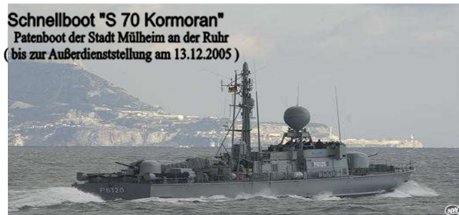
Schnellboot "S 70 Kormoran" Patentboot der Stadt Mülheim an der Ruhr (bis zur Außerdienststellung am 13.12.2005)

Seit dem 18. August 2008 besteht die Patenschaft zwischen der 5. Inspektion der Lehrgruppe B der Marineoperationsschule in Bremerhaven und der Stadt Mülheim an der Ruhr