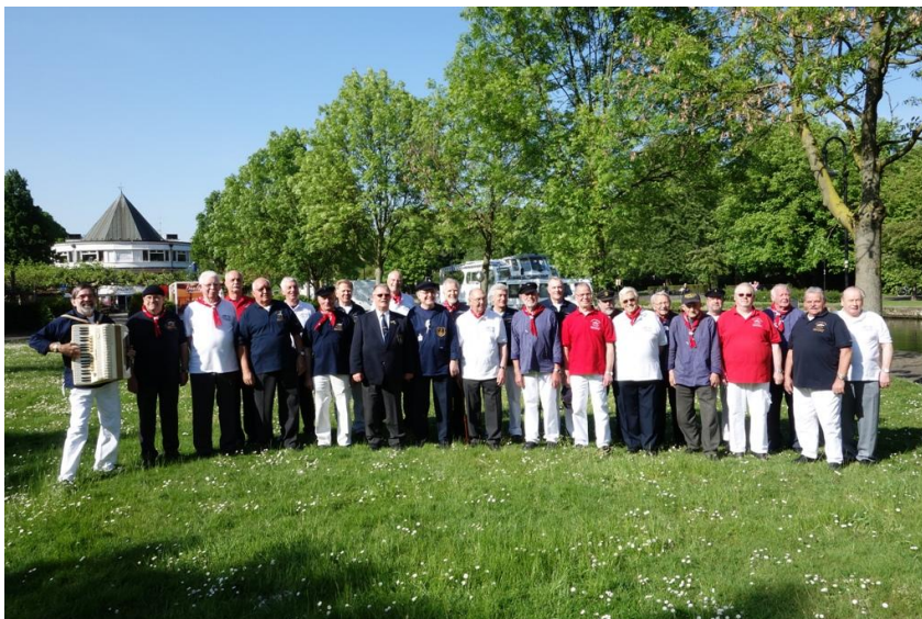
Unser neuestes Gruppenfoto, aufgenommen am 05.05.2014 (es fehlen 8 Kameraden)

Anmerkung: Die angegebenen Termine sind die z.Zt. der Heftgestaltung bekannten Termine. Es ist zu beachten, dass sich Änderungen ergeben können. Wer die Möglichkeit hat im Internet die Seite unserer MK einzusehen, www.mkmuelheim.de sollte dort die stets aktuellen Termine entnehmen.